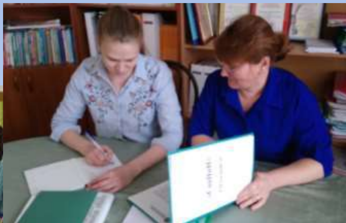
Практикум по решению педагогических ситуаций